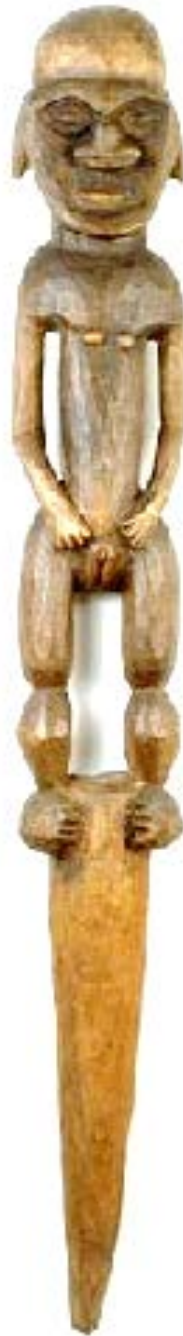
Mélanésie, Nouvelle Calédonie, XIXe siècle, Poteaux de faîtage : figures masculine et féminine, vers 1880, bois et pigments, Paris, musée Picasso.