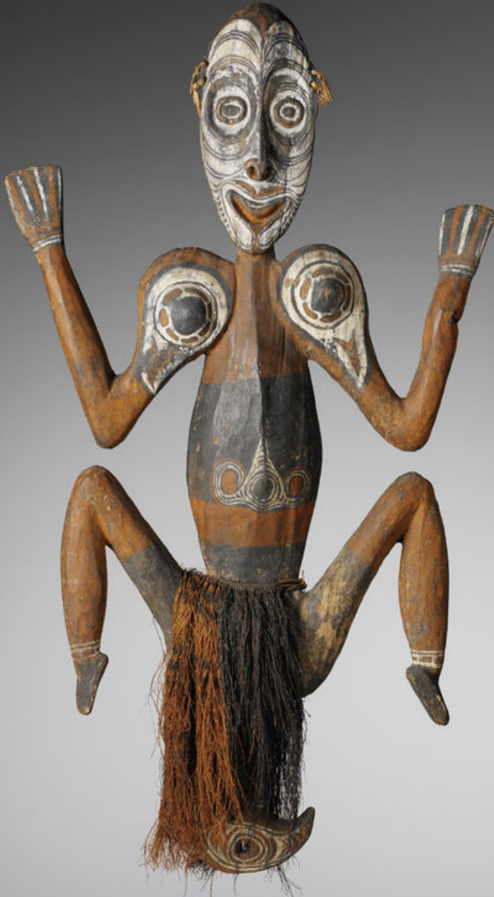
Mélanésie, Papouasie Nouvelle-Guinée, début XXe siècle, Crochet , vers 1910, bois, pigments et fibres végétales, Paris, musée du quai Branly.