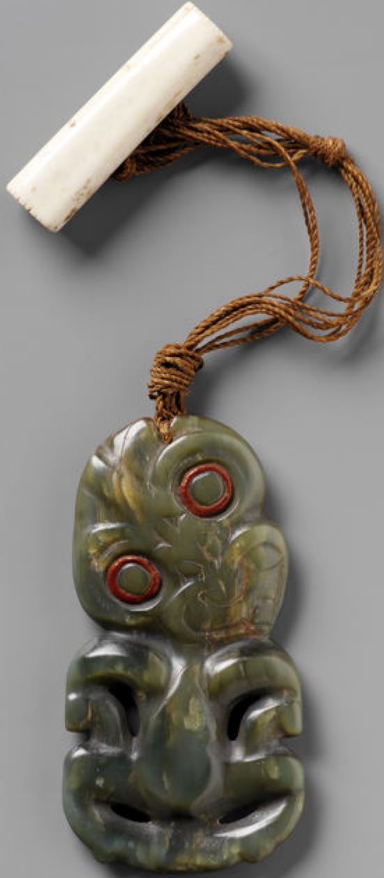
Polynésie, Nouvelle Zélande, début XIXe siècle, Pendentif 'hei tiki' , vers 1810, néphrite, fibres végétales, os et cire, Paris, musée du quai Branly.