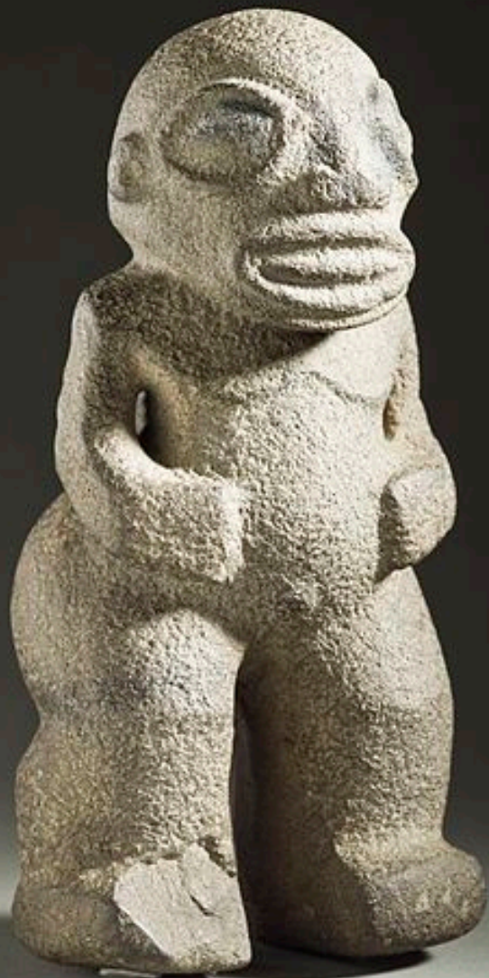
Polynésie, Iles Marquises, début XIXe siècle, Figure d'ancêtre 'tiki' , vers 1800, basalte, Los Angeles, County Museum of Art.