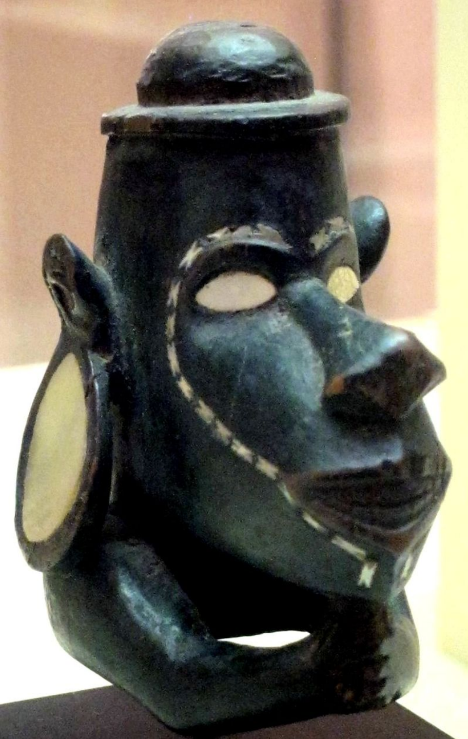
Mélanésie, Iles Salomon, XIXe siècle, Proue 'nguzu nguzu', vers 1900, bois et nacre, Honolulu, Academy of Art.