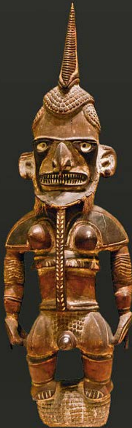
Mélanésie, Papouasie Nouvelle-Guinée, XIXe siècle, Statue 'uli' , vers 1880, bois et pigments, Berlin, musée de Dahlem.