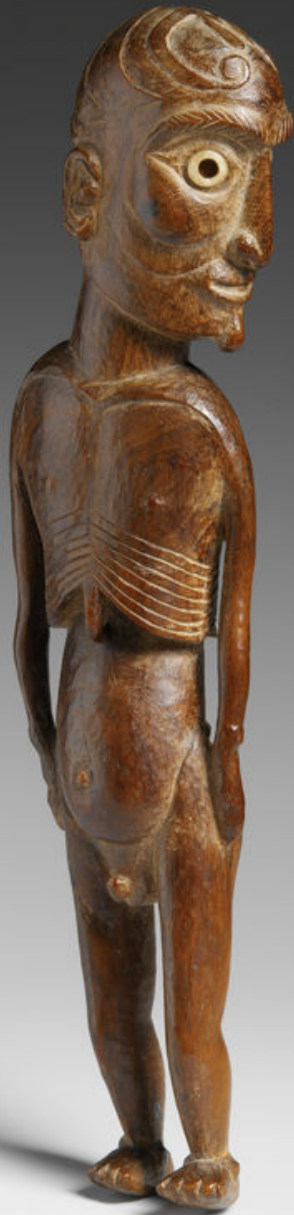
Ile de Pâques, XIXe siècle, Statuette 'moai kavakava' , vers 1830, bois, os, obsidienne, Paris, musée du quai Branly.