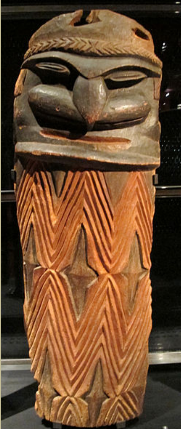
Mélanésie, Nouvelle Calédonie, XXe siècle, Chambranle de porte, vers 1950, bois et pigments, Paris, musée du Quai Branly