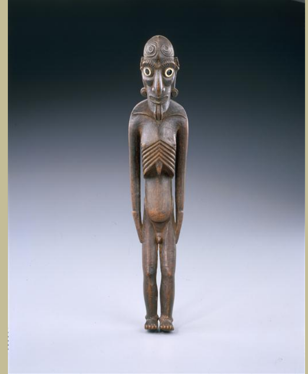
Ile de Pâques, XVIIIe siècle, Statuette 'moai kavakava' , vers 1750, bois, os, obsidienne, Paris, musée du Louvre, pavillon des Sessions.