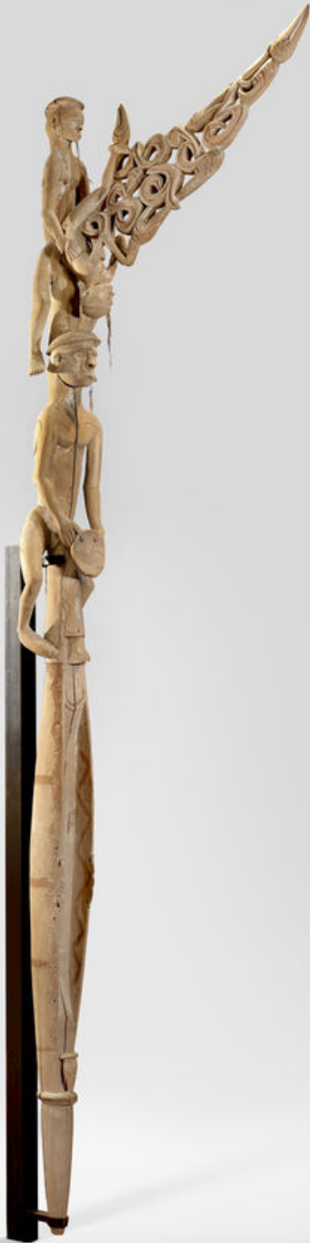
Mélanésie, Papouasie occidentale (sculpteur Jipimanam), XXe siècle, Poteau 'bisj' , vers 1930, bois et pigments, Paris, musée du quai Branly.