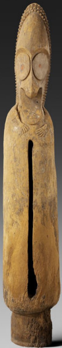
Mélanésie, Vanuatu (sculpteur Naim Lebe), XXe siècle, Tambour à fente 'atintin', vers 1935, bois, Paris, musée du quai Branly.