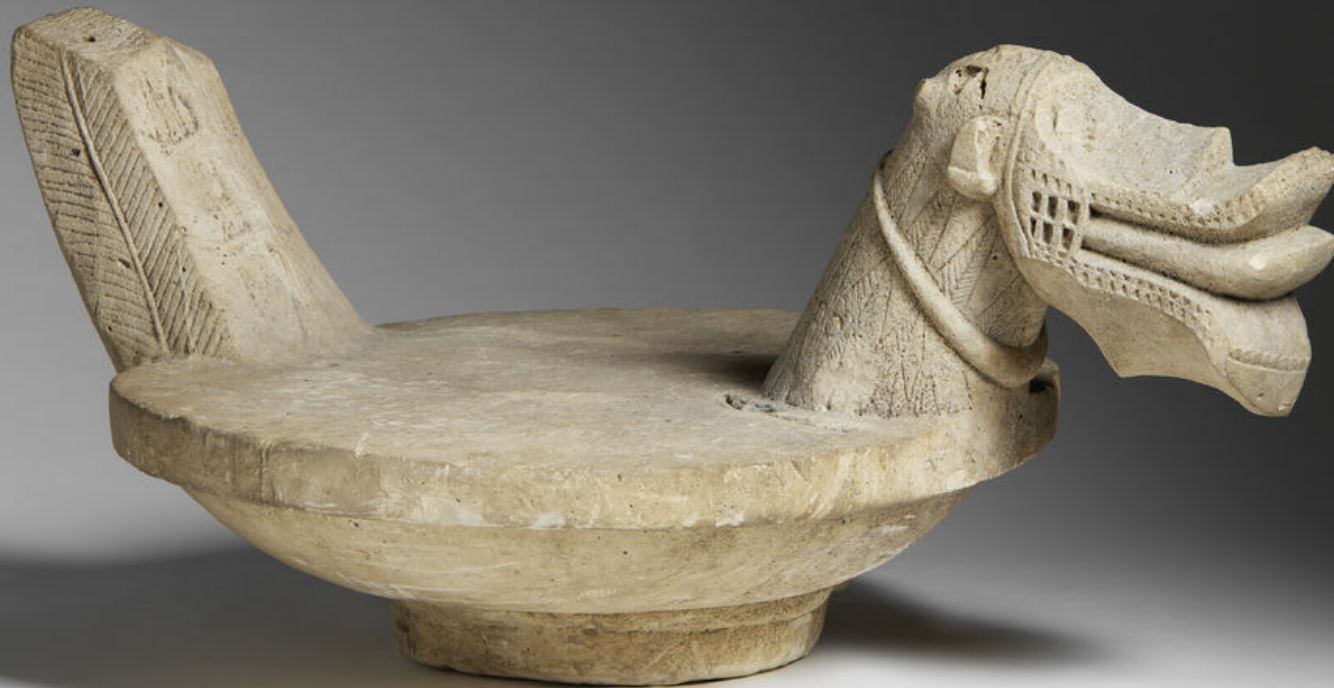
Indonésie, Ile de Nias, XIXe/XXe siècle, Siège cérémoniel 'osa osa' , vers 1880/1910, pierre, Paris, musée du quai Branly.