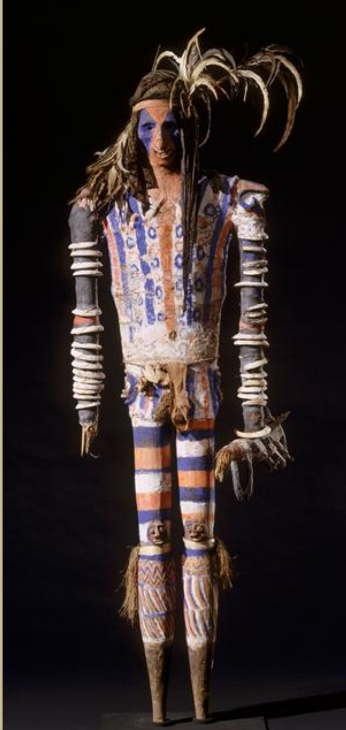
Mélanésie, Vanuatu, XXe siècle, Mannequin funéraire 'rambaramp', vers 1930, bois, terre, coquilles, os, fibres végétales, plumes, Paris, musée du quai Branly.